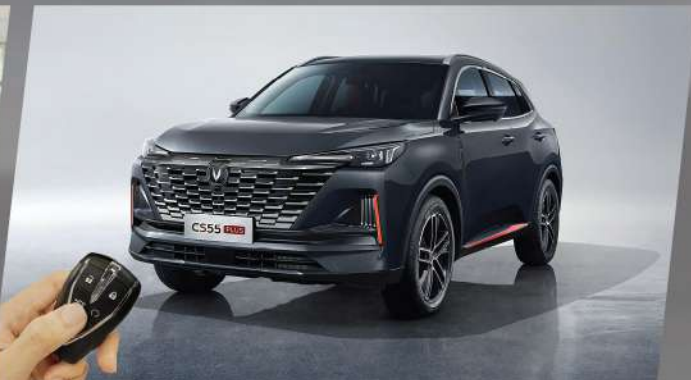
ប្រព័ន្ធបញ្ជាបញ្ជោះថយន្តពីចម្ងាយតាមរយៈ: Smart key