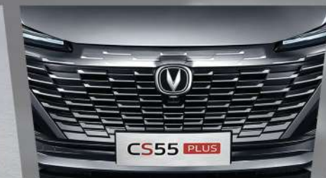
ប៉ាណា រចនាបែបទាន់សម័យ