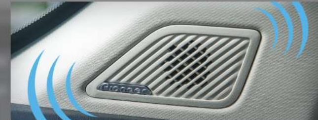
Car System Speaker Pioneer ចំនួន 6 គ្រាប់