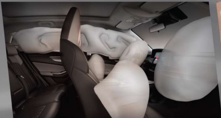
ពោងសុវត្ថិភាពចំនួន 6 ផ្តល់នូវសុវត្ថិភាពពេលជួបគ្រោះថ្នាក់ចៃដន្យ