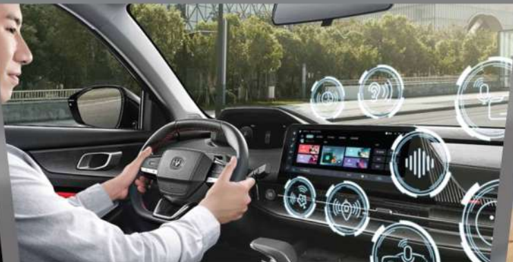
មុខងារដែលអាចធ្វើការបញ្ជា ដោយសម្លេង