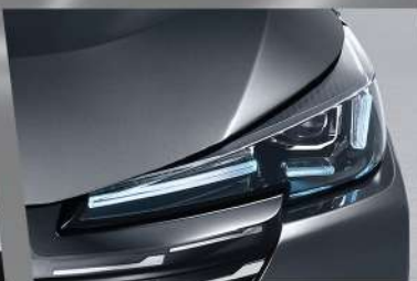
ចង្កៀងមុខរចនាបែប 3D LED