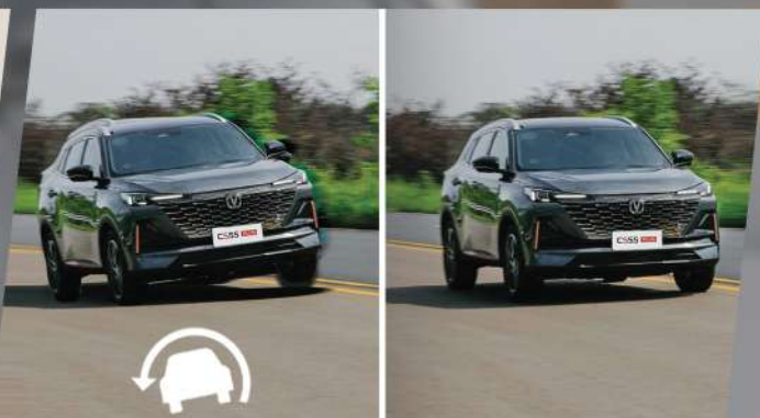
ប្រព័ន្ធរប់លំនឹង (ESP) ពេលបើកបរក្នុងល្បឿនលឿន