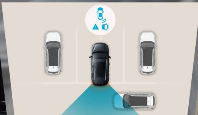
ប្រព័ន្ធជំនួយឲ្យអ្នកបើកបរងាយស្រួលមើលផ្នែកខាងក្រោយ