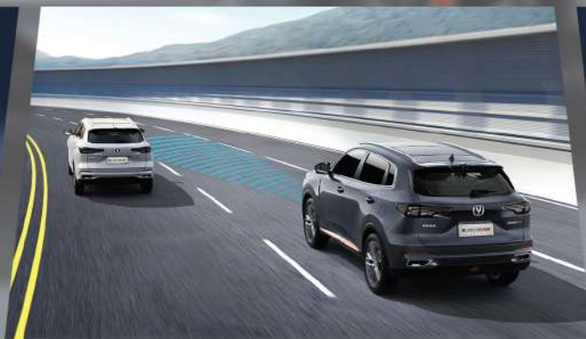
ប្រព័ន្ធកំណត់ល្បឿន ឬ បង្កើនល្បឿនស្វ័យប្រវត្តិតាមរថយន្តខាងមុខ