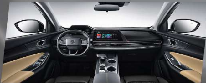
ផ្នែកខាងមុខទូលាយ និងងាយស្រួលក្នុងការបើកបរ