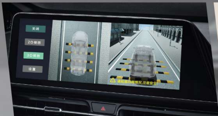
Camera 540° ជំនួយក្នុងការបើកបរ និងចូលចត