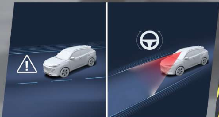
ប្រព័ន្ធជំនួយលើចង្កូត និងរំលឹកអោយអ្នកបើកបរក្នុងកន្លងត្រឹមត្រូវ