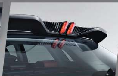
កាងក្រោយរចនាបែបរថយន្តអនាគត