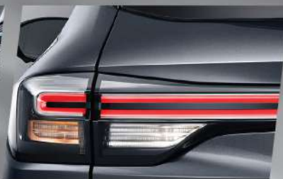
ចង្កៀងខាងក្រោយជាប្រភេទ 3D LED