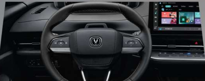
ចង្កូតអេឡិចត្រូនិច (EPAS) ធូរងាយស្រួលក្នុងការបើកបរ