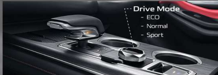
ចង្កឹះលេខរចនាទំនើប ជាមួយនឹងមុខងារ DRIVE MODE