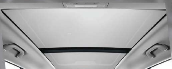
ដំបូលកញ្ចក់ Extra Large Panoramic Sky Roof