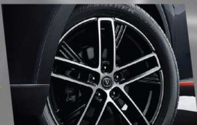
យ៉ាន់កង់ទំហំ 19 អ៊ីញ