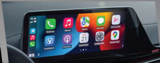
អេក្រង់ Digital 12.3 អ៊ីញ និងមុខងារ Apple Carplay