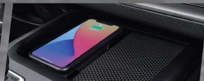
ប្រព័ន្ធសាកទូរស័ព្ទឥតខ្សែ (Wireless Charger)