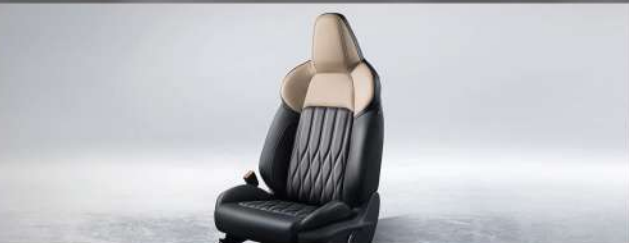
កៅអីអ្នកតូរចនាបែប Sport អាចសារបាន 6 របៀប