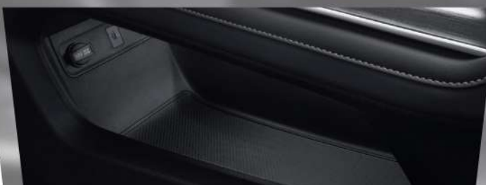
កន្លែងដាក់សំភារៈធំទូលាយ